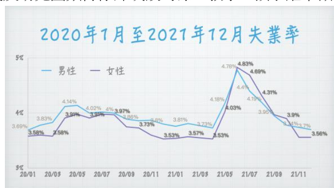
(圖說：疫情期間女性失業率明顯高於男性)