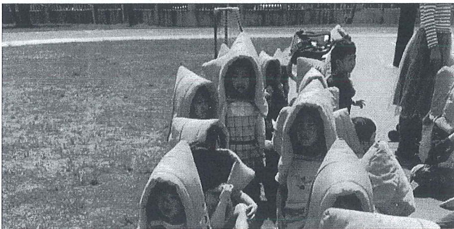
圖二、私立幼兒園幼兒避難頭部「無政府配置」安全護套